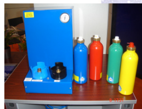
wiederbefüllbare rhoba AIRSPRAYDOSE ASD mit automatischem Füllautomat (optional)